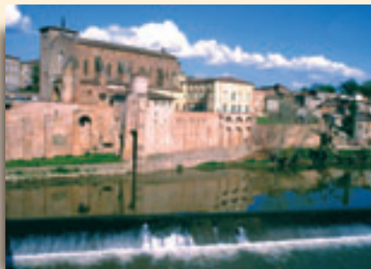
Abbatiale de Gaillac

Ce sentier offre au promeneur différents aspects de la ville et permet l'évocation du riche passé historique de la cité gaillacoise. De l'abbaye Saint-Michel, il descend vers la rivière pour suivre les berges du Tarn, la ville paraît alors bien loin ! Le quartier de l'Hortalisse et son dédale de sentes qui cheminent de jardins en jardins, raconte l'histoire des maraîchers qui, jusqu'à la moitié du xx e , alimentaient les marchés alentours. Après la traversée du centre historique, le sentier se dirige vers les rives Thomas (ancien ravin comblé et aménagé au xix e ), pour redescendre vers le Tarn et son ancien port, très prospère jusqu'à l'avènement du chemin de fer.